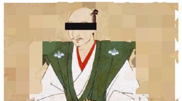
答:織田信長 (おの だいら なが)