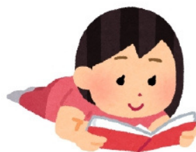
本を読む：read a book