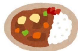
カレーライス：curry and rice