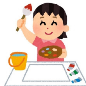
絵を描く：draw a picture