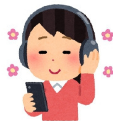
音楽をきく： listen to music