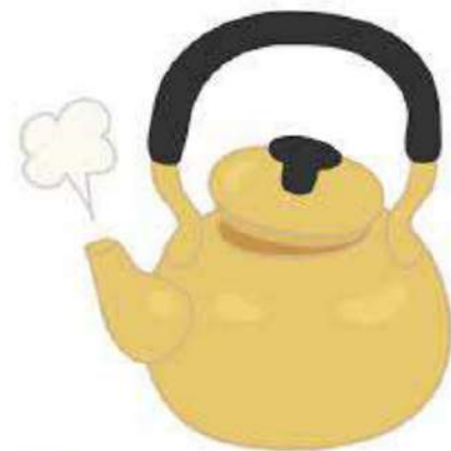
B フタのないやかん