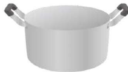
A 穴のあいているなべ